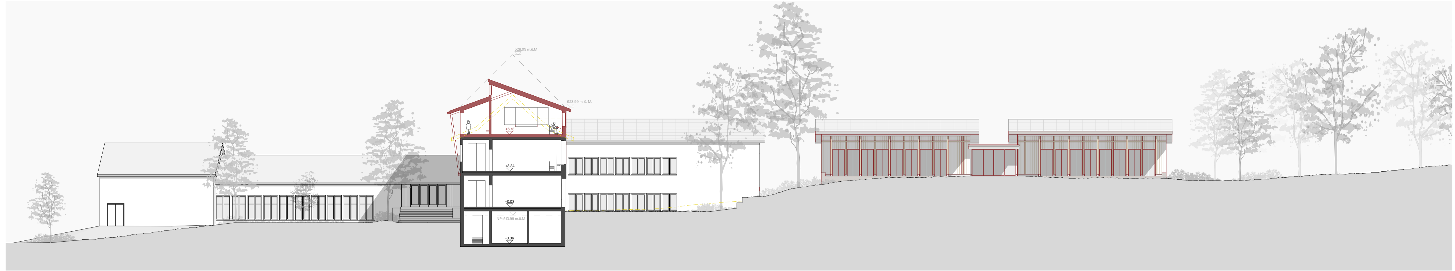
Schnitt-Ansicht Südwest 1/200

Der Schulweg führt über den neu gestalteten, begrünten Schulhaus-Hof. Dank dem Lifteinbau beim Haupttreppenhaus sind künftig alle Geschosse hindernisfrei erreichbar. Die bestehende Pausenhalle wird in Richtung Ost erweitert und bietet einen direkten Ausgang zu den Tagesstrukturen und den grünen Aussenflächen. Der Neubau steht leicht zurückversetzt zur Strasse. Die entstehende, übersichtliche Fläche entlang der Strasse kann vielfältig genutzt werden. Die mittige Raumschicht mit Eingang, Garderobe und WC bedient die Tagesstrukturen wie auch die autonom nutzbaren Mehrzweckräume. Die Haupträume sind jeweils flexibel möblier- und unterteilbar. Die Freiflächen der Schule werden ebenfalls von der ausserschulischen Betreuung genutzt.